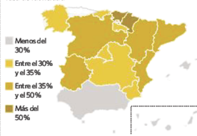
La tasa de idoneidad es el porcentaje de estudiantes que finalizan la titulación en el tiempo teórico previsto. Se consideran estudios de 4 años (cohorte de entrada 2009-2010).

en un 17 por ciento, para las presenciales, en un 16,01 por ciento y para las no presenciales, en un 24,2 por ciento. La comunidad que lidera el ranking en abandono es La Rioja, seguida de Madrid; y en el final de la lista, Castilla y León y Navarra.