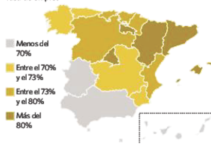
Egresados en grado y primer y segundo ciclo en el curso 2009-2010, situación a finales de 2014.

Fuente: Informe Las Universidades Españolas. Una perspectiva autonómica 2016. Fundación CYD.