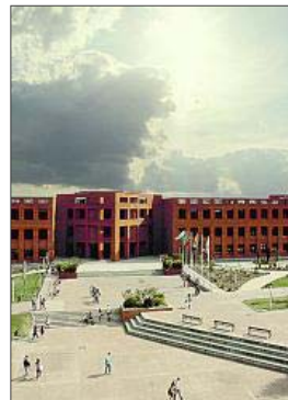
Campus UAX. EE

Para el desarrollo de la UAXapp , se ha contado con la colaboración de Universia, incorporando tecnología avanzada y contenidos y servicios diversos. Por otra parte, con la apli-