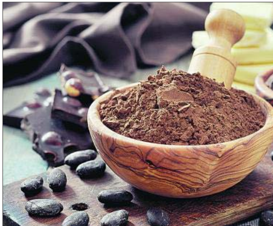
Granos de cacao molidos.