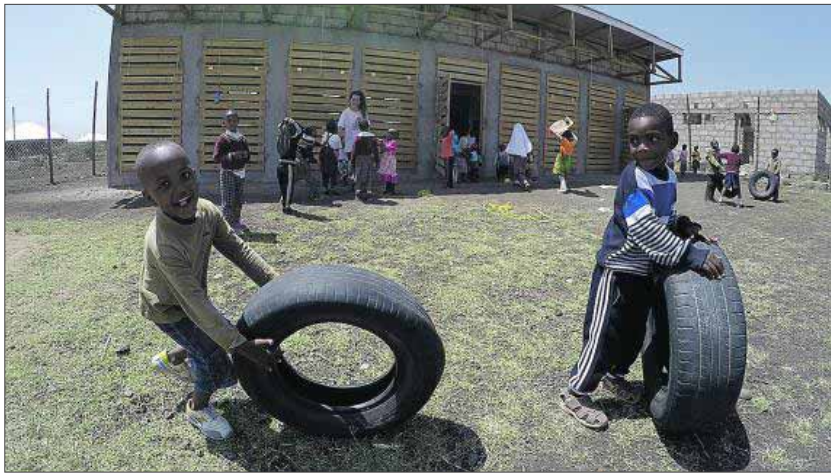
Niños que participan en el proyecto ONG Progress. EE