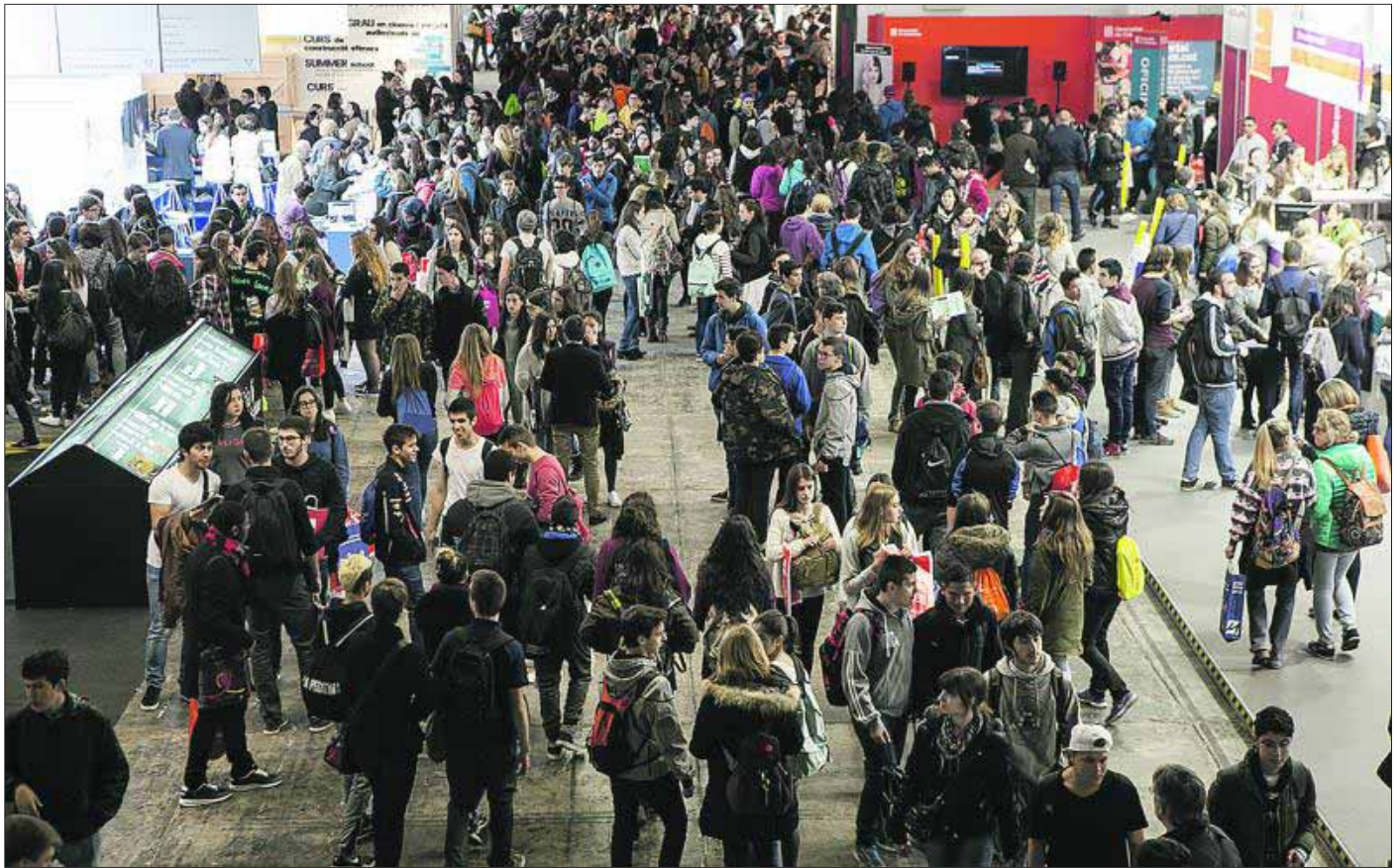
Estudiantes en el Salón de la Enseñanza en la edición de 2016. EE