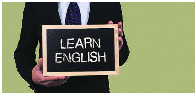
Un directivo ampliando sus conocimientos en inglés.

Entre las cuestiones que se han estudiado destacan qué habilidades (orales o escritas) son más utilizadas, cuáles son los requerimientos de las empresas en función de sectores y puestos de trabajo y cuáles son las deficiencias que se encuentran entre el uso del inglés y los conocimientos de este idioma, entre otros.