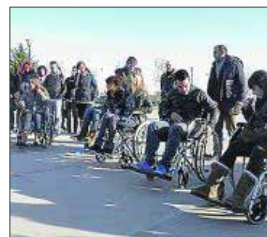
Alumnos en silla de ruedas.

mación presencial en las aulas con formación práctica en empresas como Inditex, Fundación Santiago Rey, Cruz Roja, Padre Rubinos, Decathlon, R o Ikea, entre otras firmas. Cuenta con 15 estudiantes por curso e incluye además sesiones de apoyo y atención a las familias. La formación que reciben no se limita a una especialidad concreta, sino que se plantea dentro de un enfoque amplio que capacite al alum-